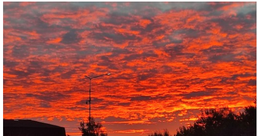
Jaromír Laibl ml.