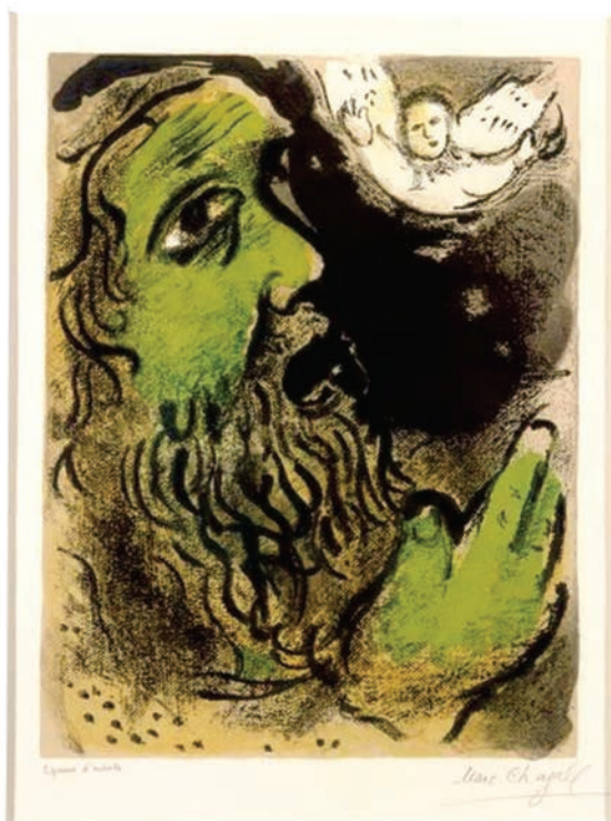
Ilustrace: Modlící se Job, Marc Chagall, 1960.