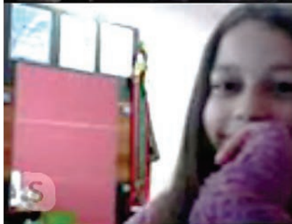
On-line výuka matematiky