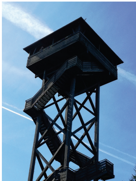
Rohhledna v Bavorsku