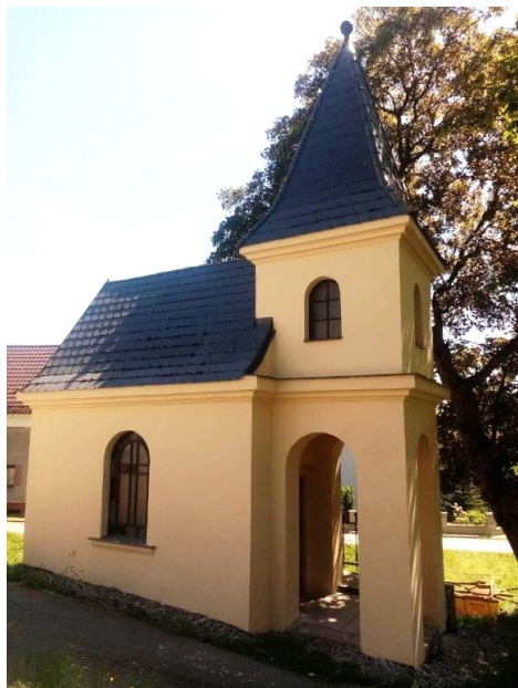
Kaplička ve Víchově v novém kabátku