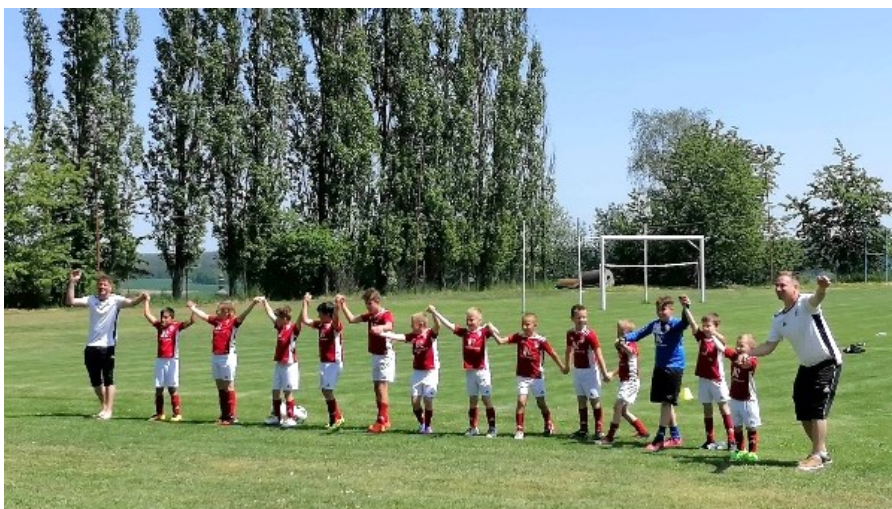
Turnaj na domácí půdě - naši nejmladší fotbalisté