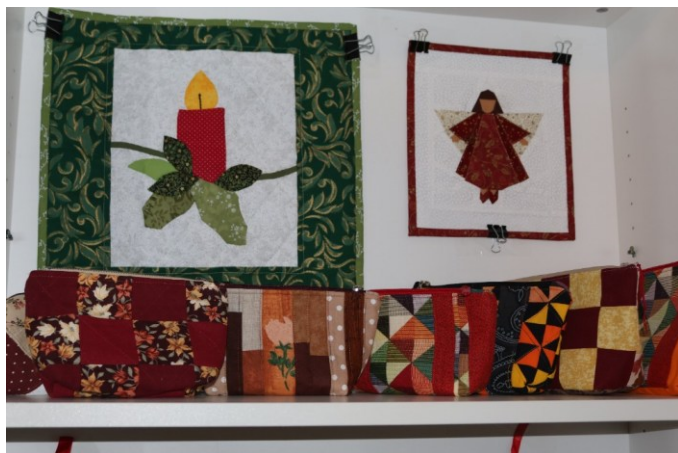
Martina Sihelská muzeum