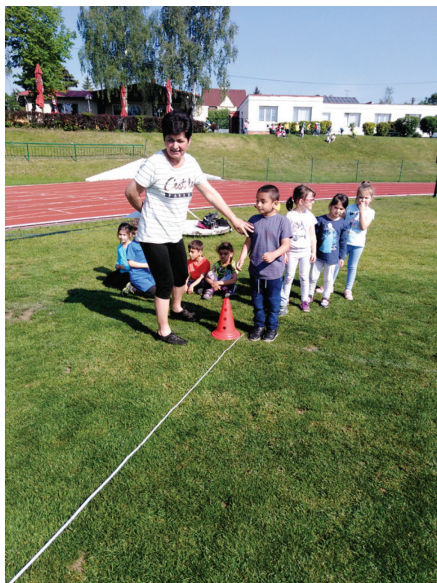
Kolektiv zaměstnanců mateřské školy

Přejeme všem dětem i rodičům krásné letní dny.